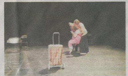
■ Trois en scène, c'est rassurant.