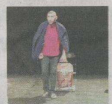
■ Seul en scène, c'est impressionnant.