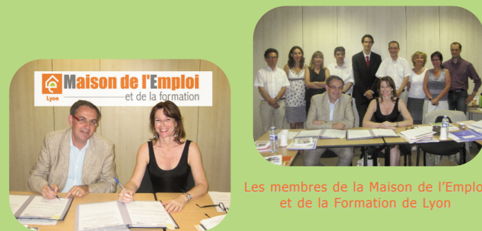
Les membres de la Maison de l'Emploi et de la Formation de Lyon

Le processus de collaboration des développeurs économiques présents sur le territoire de la Ville de Lyon est le même pour chaque projet de développement du territoire.